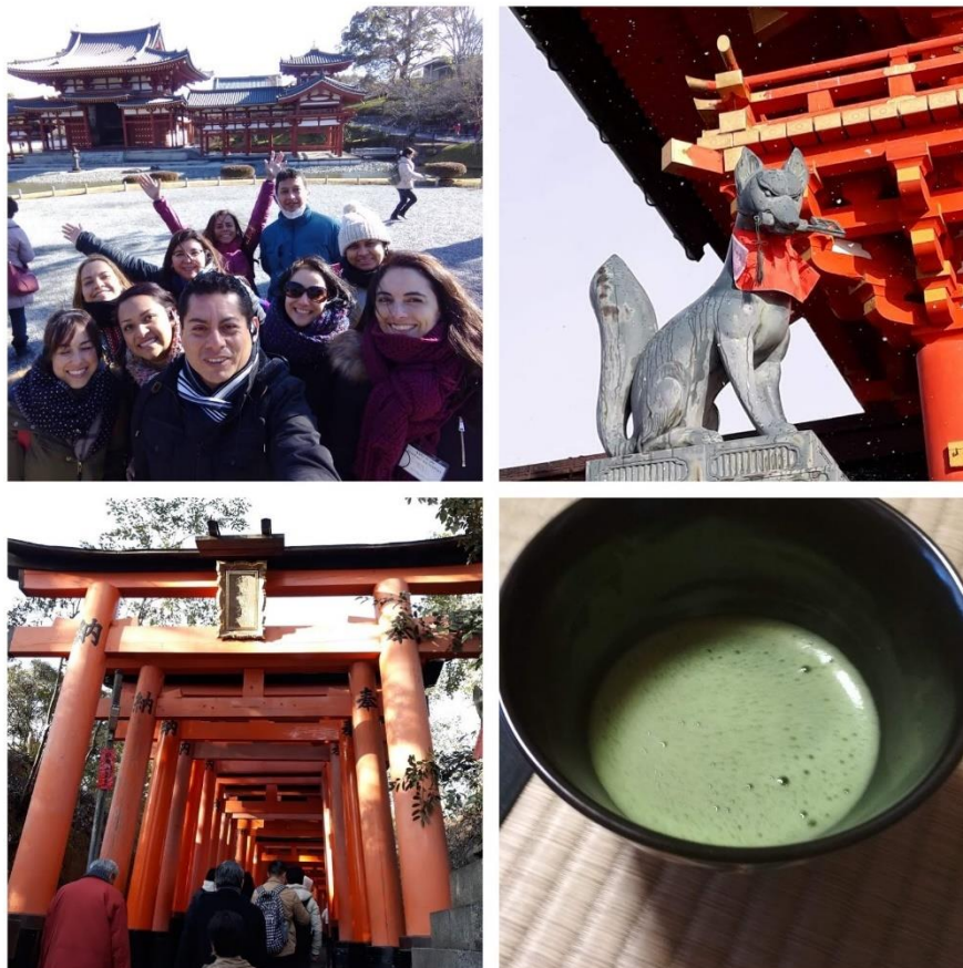
Templo Byodoin, ceremonia de té verde (Maccha) y Santuario de Fushimi Inari de Kyoto

El intercambio cultural se desarrolló a través de clases de conversación en japonés, charlas sobre la historia y cultura de Japón, y la visita a una escuela primaria en Osaka. También se organizaron visitas a templos y museos en ambas ciudades.