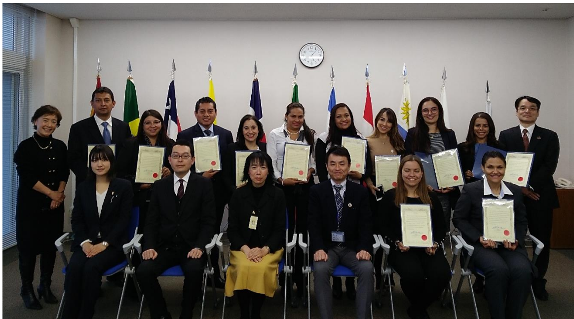
Entrega de certificados

Estas medidas, sumadas a la disciplina que caracteriza a la cultura japonesa explican el nivel de organización y certidumbre que caracteriza a la gestión de la Aduana de Japón.