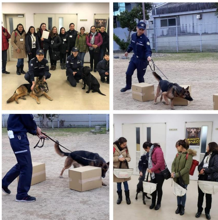
Demostración de equipo canino