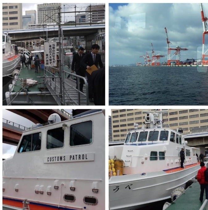
Buque de supervisión en el puerto de Kobe