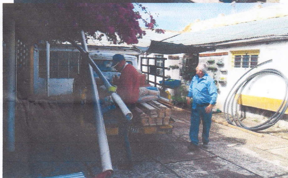
Especial para Discapacitado Intelectual Bella Unión-Dpto. Artigas. Escuela N°84